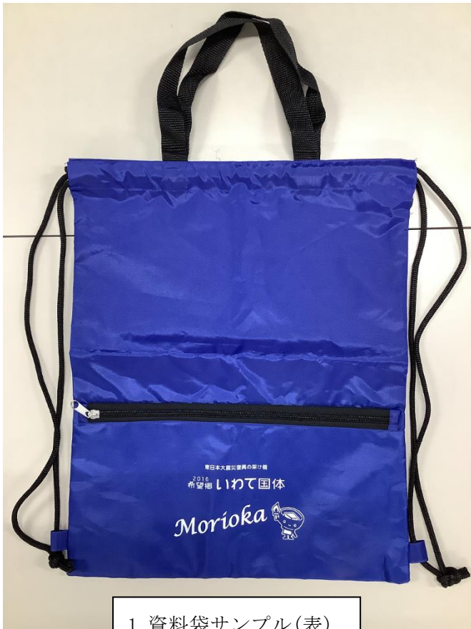
1. 資料袋サンプル(表)