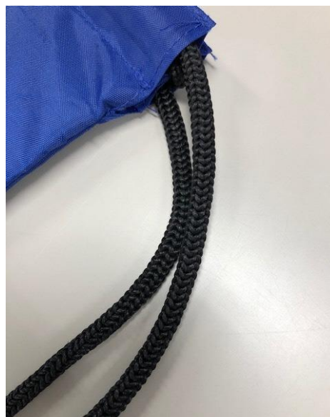
5. 資料袋サンプル(ポリプロピレン黒紐)