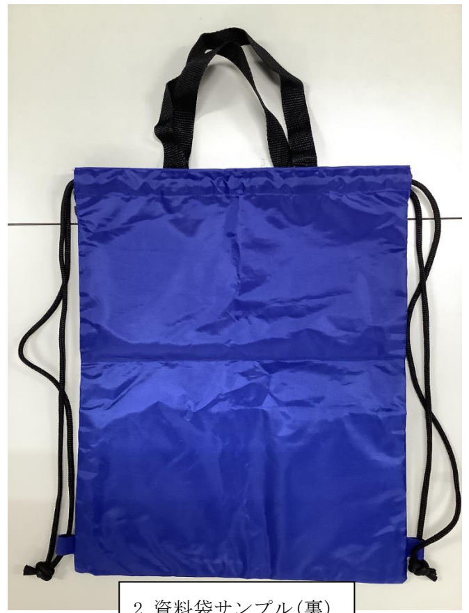
2. 資料袋サンプル(裏)